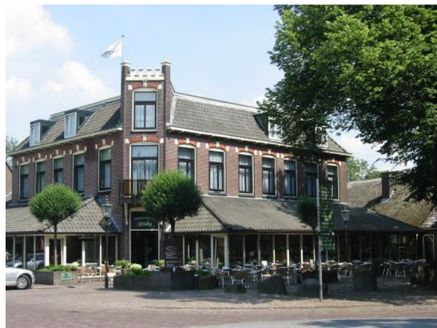
Hotel Wesseling in Dwingeloo

De totaalprijs per persoon zal ongeveer € 200,- gaan bedragen voor een 2-persoonskamer. Mocht iemand zo'n kamer voor zich alleen willen hebben, dan kost dat € 20,- meer. Ook nu voeren we een voorinschrijving in van € 25,-. Dat wil zeggen dat we graag zien dat diegenen die zeker weten dat ze meegaan zich per e-mail of gewone post bij mij opgeven en tevens € 25,- storten op het rekeningnummer van de Penningmeester van de Skivereniging Het Gooi (NL64 RABO 0388 2962 08) o.v.v. FW2015.